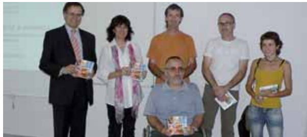
Presentació de la Guia Accessibilitat a Manresa